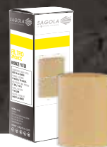
Siekany filtr z brązu 20 \mu